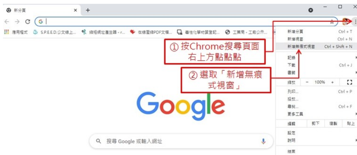
圖 1、以無痕網頁開啟視訊連結