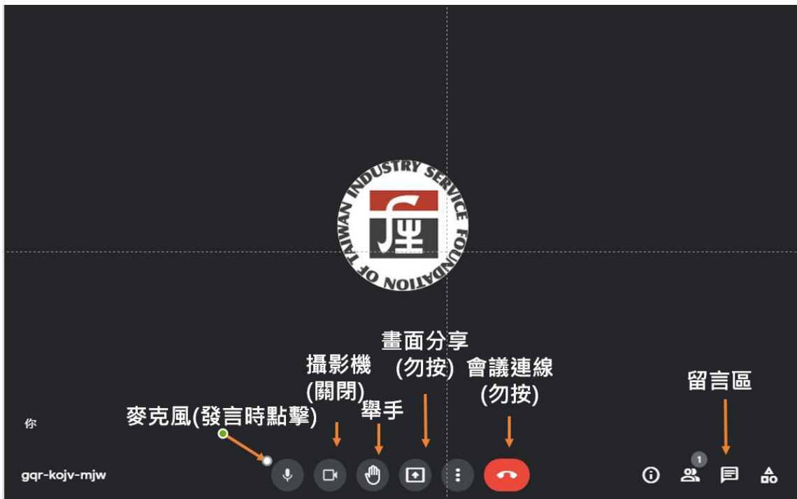
圖 3、google meet 各重要按鈕功能