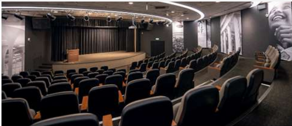
圖 1 成果發表會舉辦地點